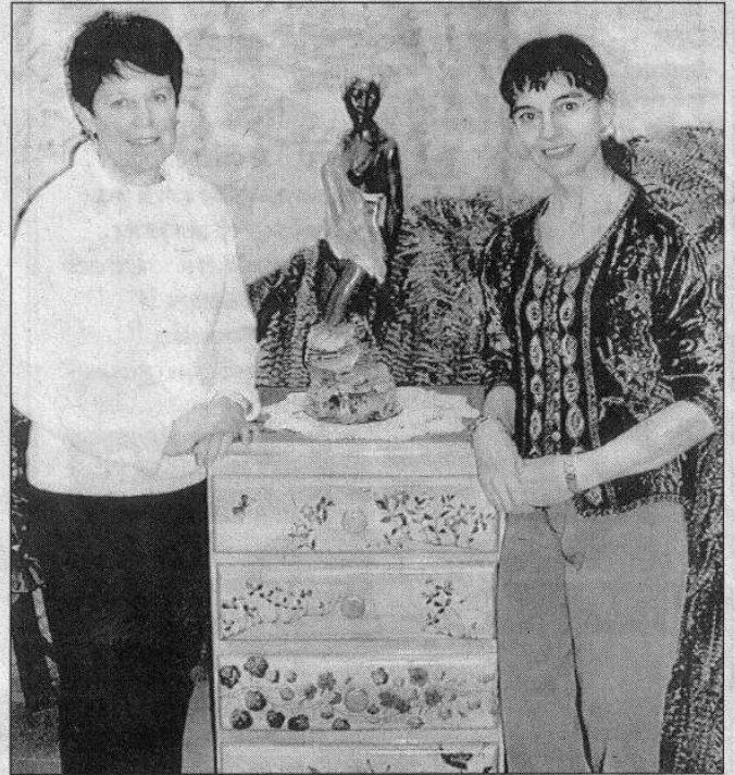
Les deux artistes réunies à Vendargues pour une exposition.

► Exposition espace Teissier, rue du Général-Berthézène, à Vendargues, du 6 au 14 mars, ouverte les samedis et dimanches de 10 h à 12 h et de 14 h à 20 h, du lundi au vendredi, de 14 h à 18 h.