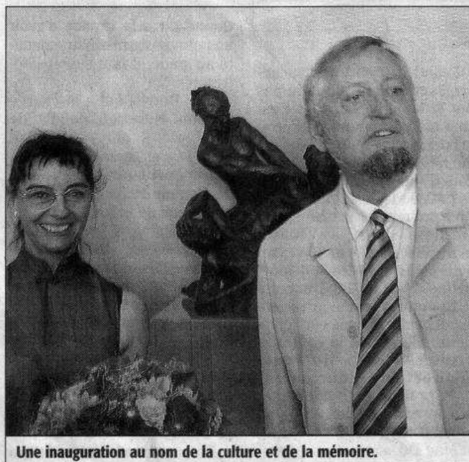
Une inauguration au nom de la culture et de la mémoire.

La sculpture représente trois attitudes d'esclaves face à l'esclavage et à la liberté.